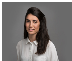
תות סאלס עורכת דין