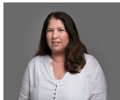
שירי שני שותפה