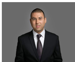
מאור ישראלי שותף