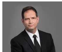
יועד כוכבי שותף